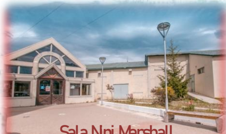
Sala Nni Marshall