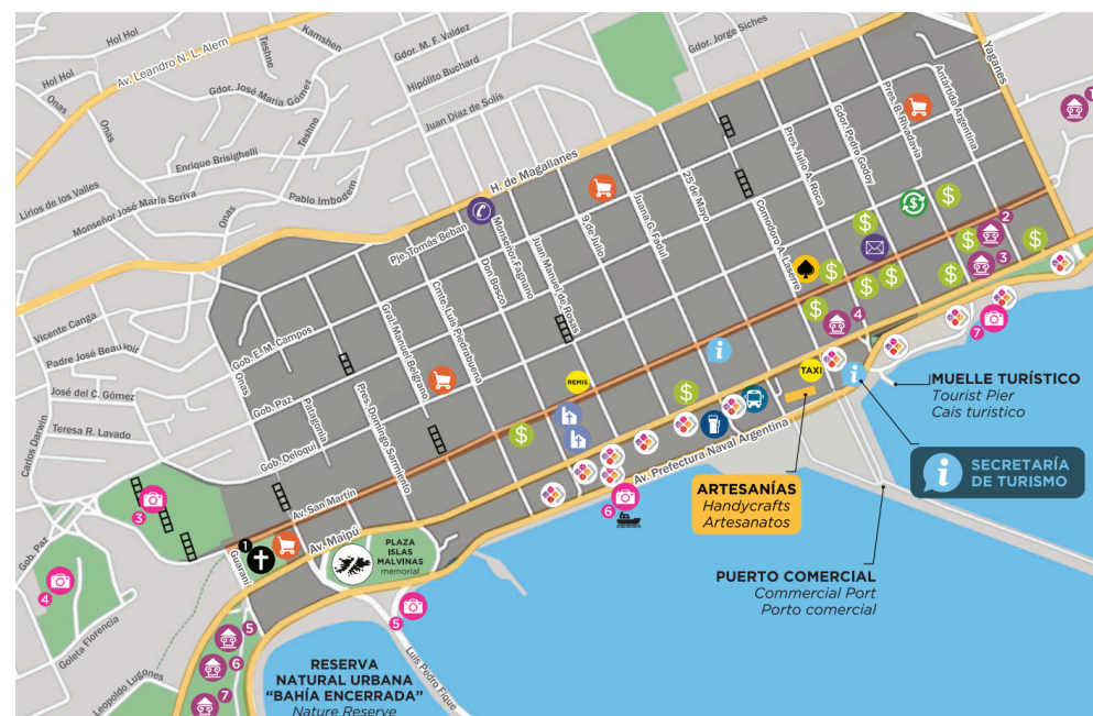
Mapa Zona Centro

Plaza 25 de Mayo -Maipú y Lasserre - Diariamente de 10 a 20 hs.