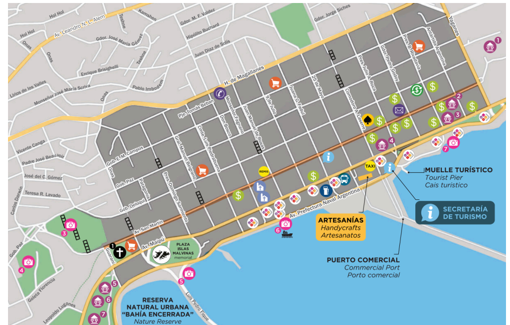
Mapa Zona Centro

Le long de la Place 25 de Mayo, sur Av. Maipú entre la rue 25 de Mayo et Lasserre. Tous les jours de 10h à 20h.