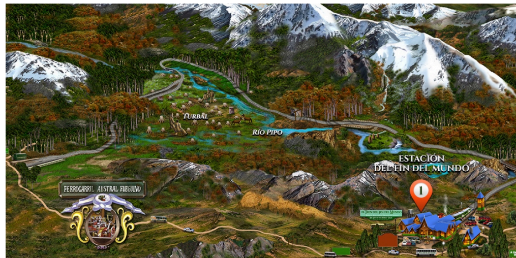
Image illustrative du parcours

Les cartes de crédit Visa, Mastercard et American Express sont acceptées. Les paiements en espèces sont acceptés en pesos, dollars, euros et reais.