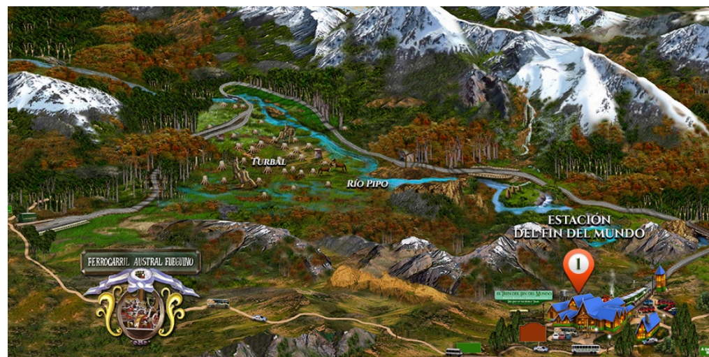
Image illustrative du parcours

Les cartes de crédit Visa, Mastercard et American Express sont acceptées. Les paiements en espèces sont acceptés en pesos, dollars, euros et reais.